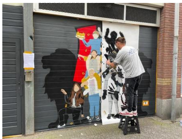
Muurschildering van Kinderwijkraad Staatsliedenbuurt geplaatst in Van Limburg Stirumstraat