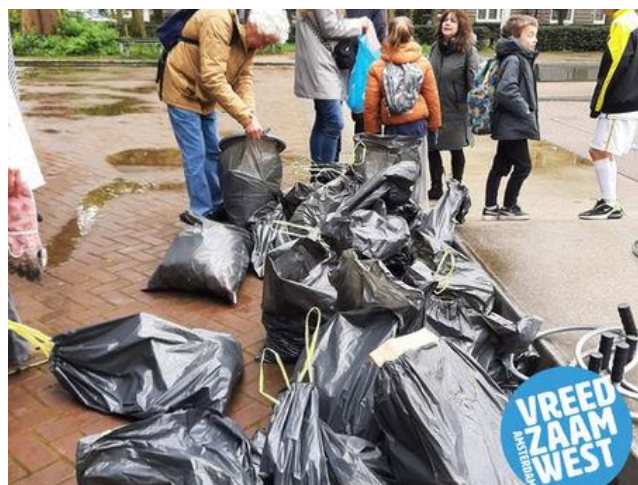
Kinderwijkraaden Staatsliedenbuurt en De Baarsjes maken de buurt schoon