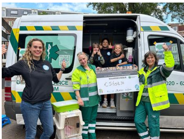
Kinderwijkraad Staatsliedenbuurt haalt bijna €7000 op voor Dierenambulance Amsterdam